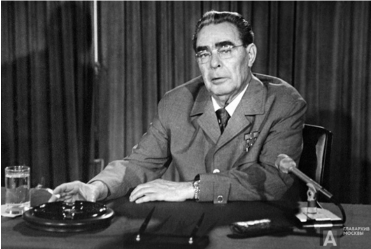
Abb. 3: Generalsekretär des ZK der KPdSU, Vorsitzender des Präsidiums des Obersten Sowjets der UdSSR Leonid Breschnew während der Aufzeichnung einer Rede im Fernsehen.

Foto: V.B. Sobolev ©, Moskau, Ende der 1970er Jahre, in: Livejournal, 19.12.2020, https://onopenko.livejournal.com/315557.html [25.10.2023]