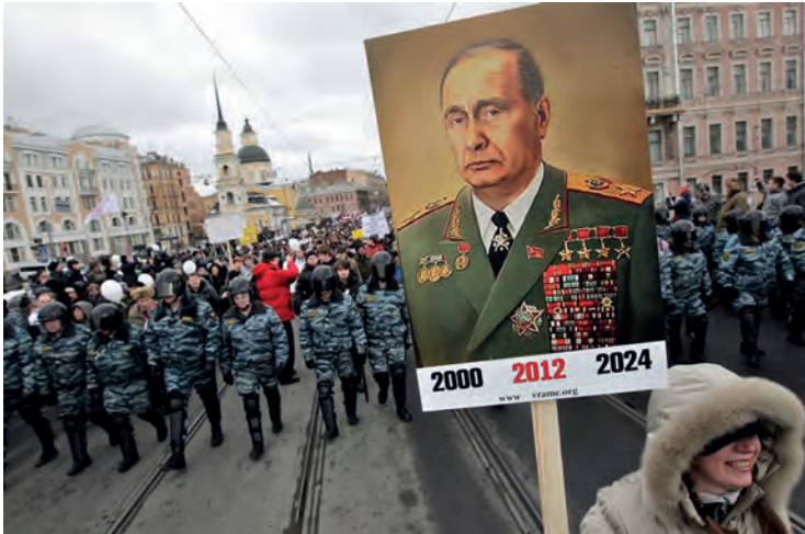
Abb. 4: Eine Demonstrantin trägt ein Plakat, das Putin als älteren sowjetischen Generalsekretär mit Zügen Leonid Breschnews zeigt. St. Petersburg, 25. Februar 2012.