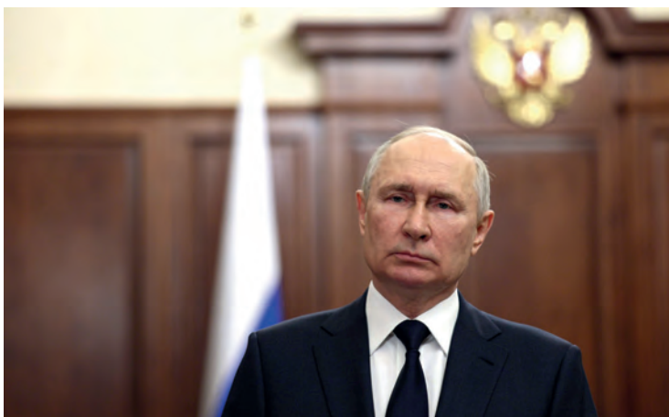
Abb. 2: TV-Ansprache Wladimir Putins, 26. Juni 2023.