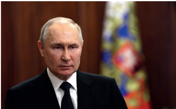
Abb. 1: TV-Ansprache Wladimir Putins, 24. Juni 2023.